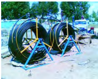
Rys. 7. Sondy podwójne typu U z głowicami