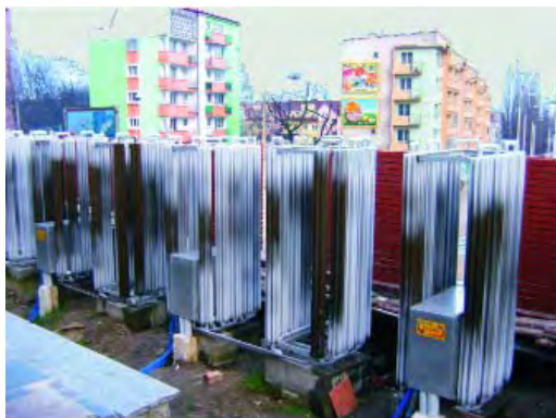
Rys. 3. Wymienniki ciepła dolnego źródła pomp ciepła ECON 6

trze zewnętrzne). Pompy ciepła eksploatowane są w biwalentnym układzie kaskadowym, a szczytowe źródło ciepła stanowią dwa kotły grzewcze typu CSI 99 o mocy 115 kW każdy, opalane peletami.