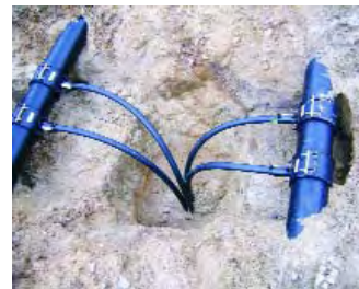
Rys. 9. Podłączenie sondy podwójnej do rurociągów magistralnych

Włączenie pomp ciepła ECON-6 i pompy Alpha Inno Tec LW 190 M-1 do powrotów zamkniętych układów centralnego ogrzewania zabezpiecza te pompy przed zbyt wysoką temperaturą powrotu, która może wystąpić po uruchomieniu kotłów na pelety.