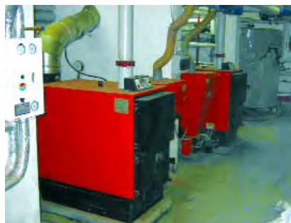
Rys. 5. Wodny kocioł grzewczy na pelety CSI-99 o mocy 115 kW