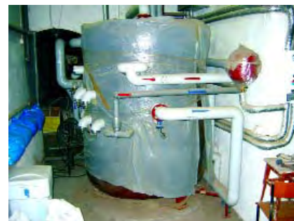
Rys. 6. Zbiornik buforowo-akumulacyjno-rozdzielczy WODTERM 1500L