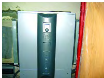
Rys. 4. Pompa ciepła systemu powietrze /woda Alpha InnoTec LW 190 M-1 o mocy 18,5 kW

• pompa ciepła systemu powietrze /woda ECON-6 o mocy 25,2 kW – 4 szt.; oszronione wymienniki tych pomp, za pośrednictwem których pobierane jest niskotemperaturowe ciepło z powietrza zewnętrznego pokazano na rys. 3,