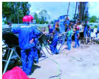
Rys. 8. Zapuszczanie sondy podwójnej